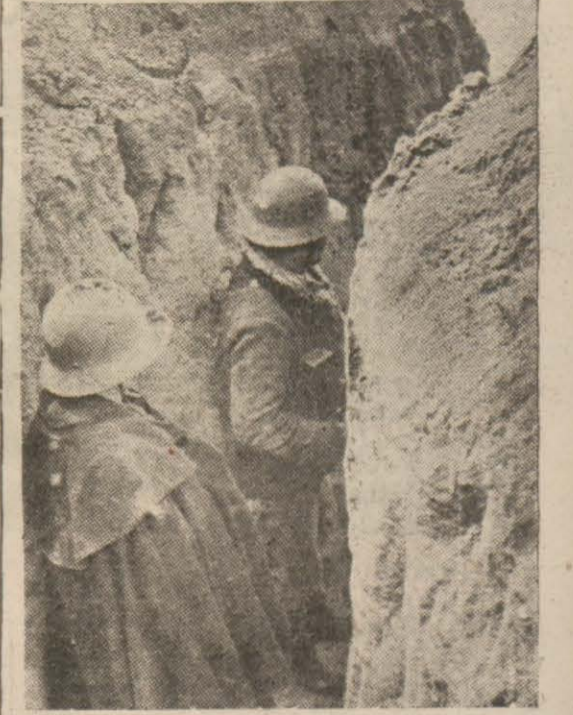
İspanyada cumhuriyetçiler siperlerde

Bay Musolininin vaktinden evvel Libyadan dönmesi, İtalyanın Paris sefiri