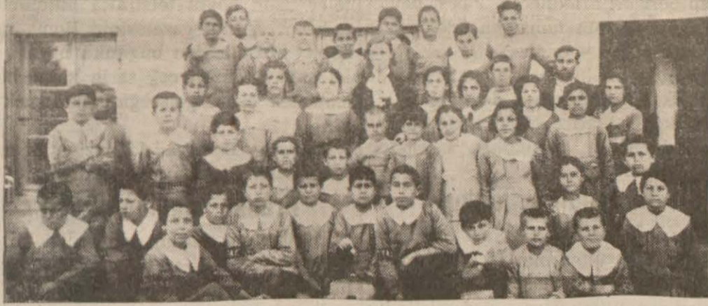
Sakarya mektebinin Hava Kurumuna yardım eden talebeleri

Manisa (Hususi) — Sakarya mektebinde Hava kurumuna yardım kolu teşkil edilmiştir. Tayyarenin mühim rolünü çok yakından takdir eden