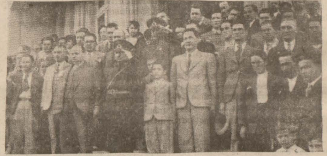
Bayrama iştirak edenler istiklâl marşını dinlerlerken

Aynı yirmi birinde İzmirde de toprak bayramı yapılmıştır. Davetli köylülerle şehirli Ziraat mektebinde toplanmışlar, hep bir arada çalınan istiklâl marşını ve söylenen nutukları dinlemişlerdir. Toplantı neşeli olmuş, köy kadınları bu toplantıya millî kılıkları ile iştirak etmişlerdir. Toplantıya Vali de iştirak etmiştir.