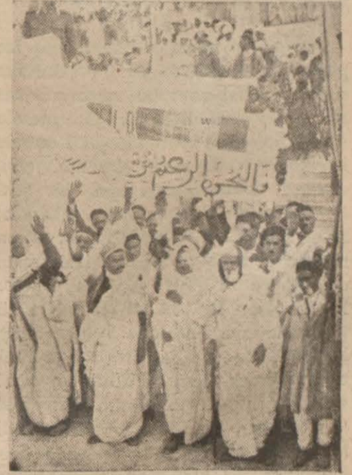
Bay Musoliniyi son Trablusgarp seyahatında selâmlayan Araplar

“İtalya bugünkü siyaseti ile Şarkı Afrika kazandığı zaferden azami fayda temin etmeye çalışmaktadır. İtalya bu dakikada birçok müslümanlar arasında (Devamı 2 inci sayfada)