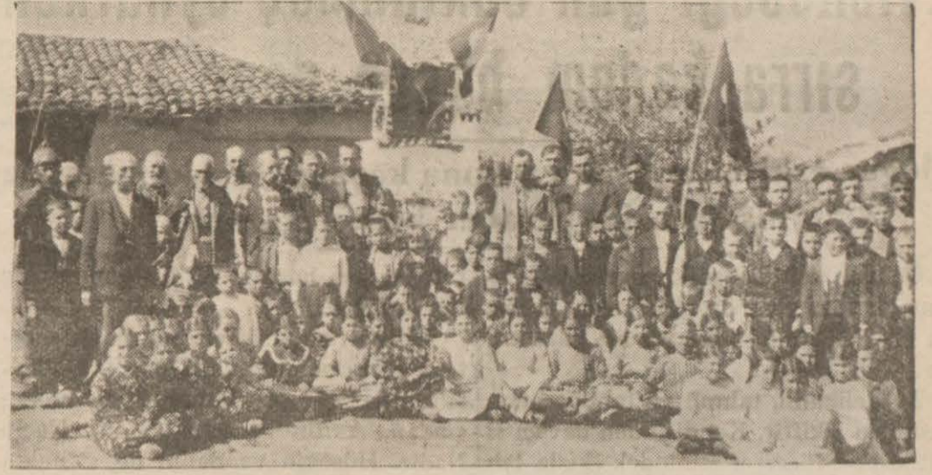
Tatar köyünde köylüler ve köylü talabeler Mehmetçik âbidesine çelenk koyduktan sonra

Lüleburgaz (Hususi) — Köy kalkınma kanununun Büyük Millet Meclisinde kabulü tarihinin yıldönümü, Lüleburgaz köylülerinde parlak tezahüratla kutlanmıştır.